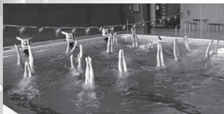
Die Spargel-Saison ist lanciert – oder eine Vorübung zum Wasserspringen.