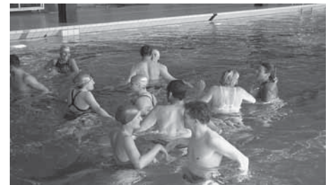
Treffpunkt Aqua: sich gegenseitig beschnuppern und kennen lernen.

sorgte, die täglich 3–5 Stunden im Hallenbad könnten selbst einer überzeugten Wasserratte zu viel werden, wurde eines Besseren belehrt. Die Lektionen waren abwechslungsreich und lehrreich, zeigten sie doch pädagogische Anliegen auf exemplarische Weise und boten die Gelegenheit, die unterschiedlichen Schwimmsportdisziplinen auf spielerische Art neu zu entdecken. Im Hallenbad wurden wir in die Rolle des Schwimmschülers versetzt, welcher die Wasserwelt mit allen Sinnen entdeckt und immer wieder neue Bewegungserfahrungen sammelt.