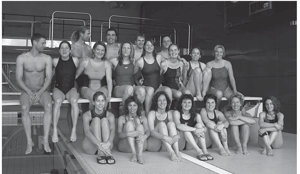
Teilnehmende SI-Kurs 2005 (von links nach rechts)

Avec mes messages cordiaux Dany Sollero Responsable de formation Cellule romande