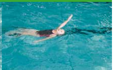
50 m schwimmen und aussteigen