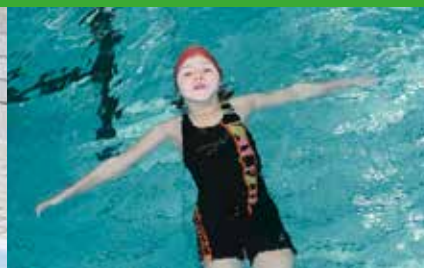
1 Minute an Ort über Wasser halten