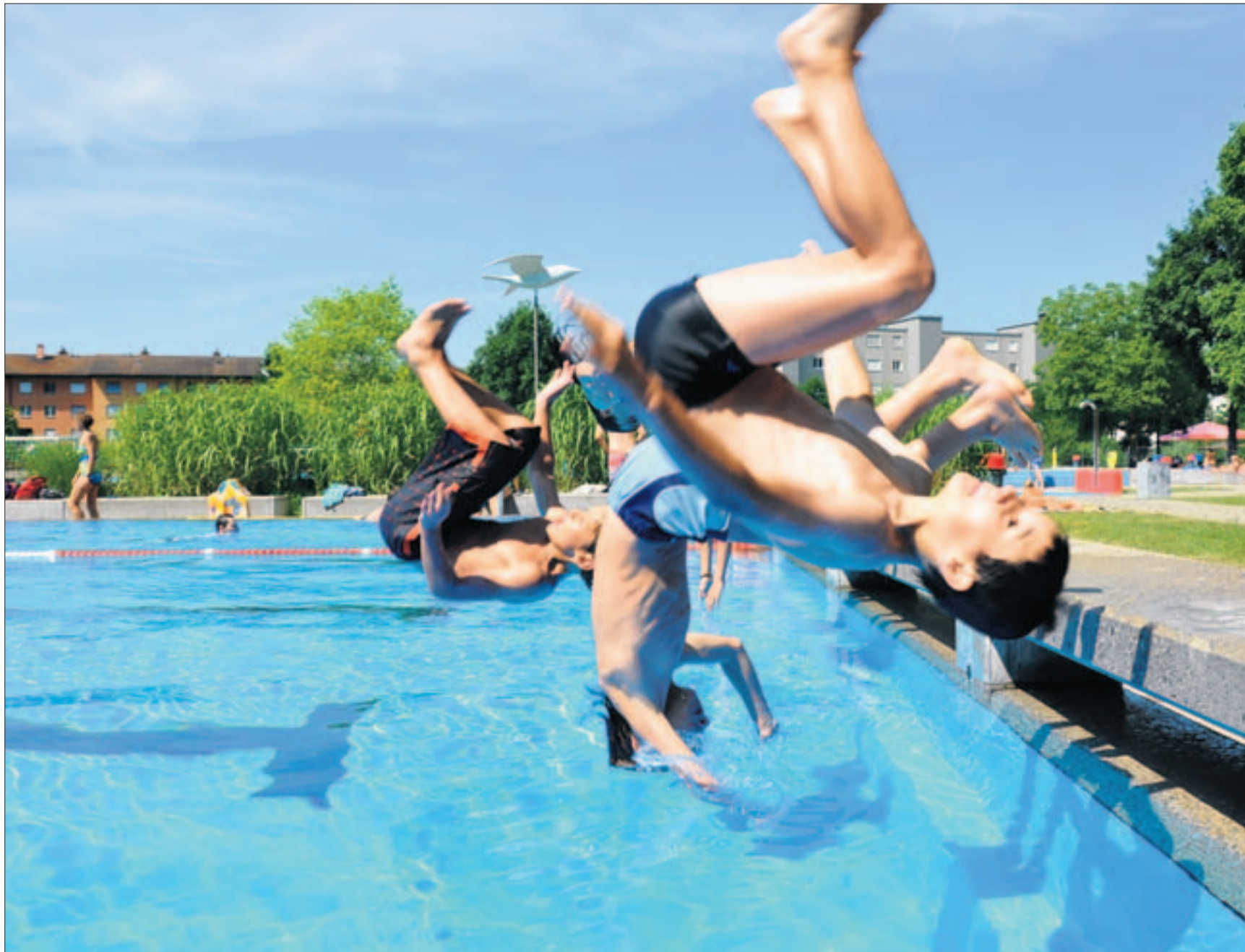
Der Sturz ins Wasser wird durch einen Purzelbaum simuliert. Einige Primarschüler machen daraus einen mehr oder weniger geglückten Salto. (Thierry Haecy)

Bülach Der Wasser-Sicherheitscheck soll Kinder vor dem Ertrinken bewahren